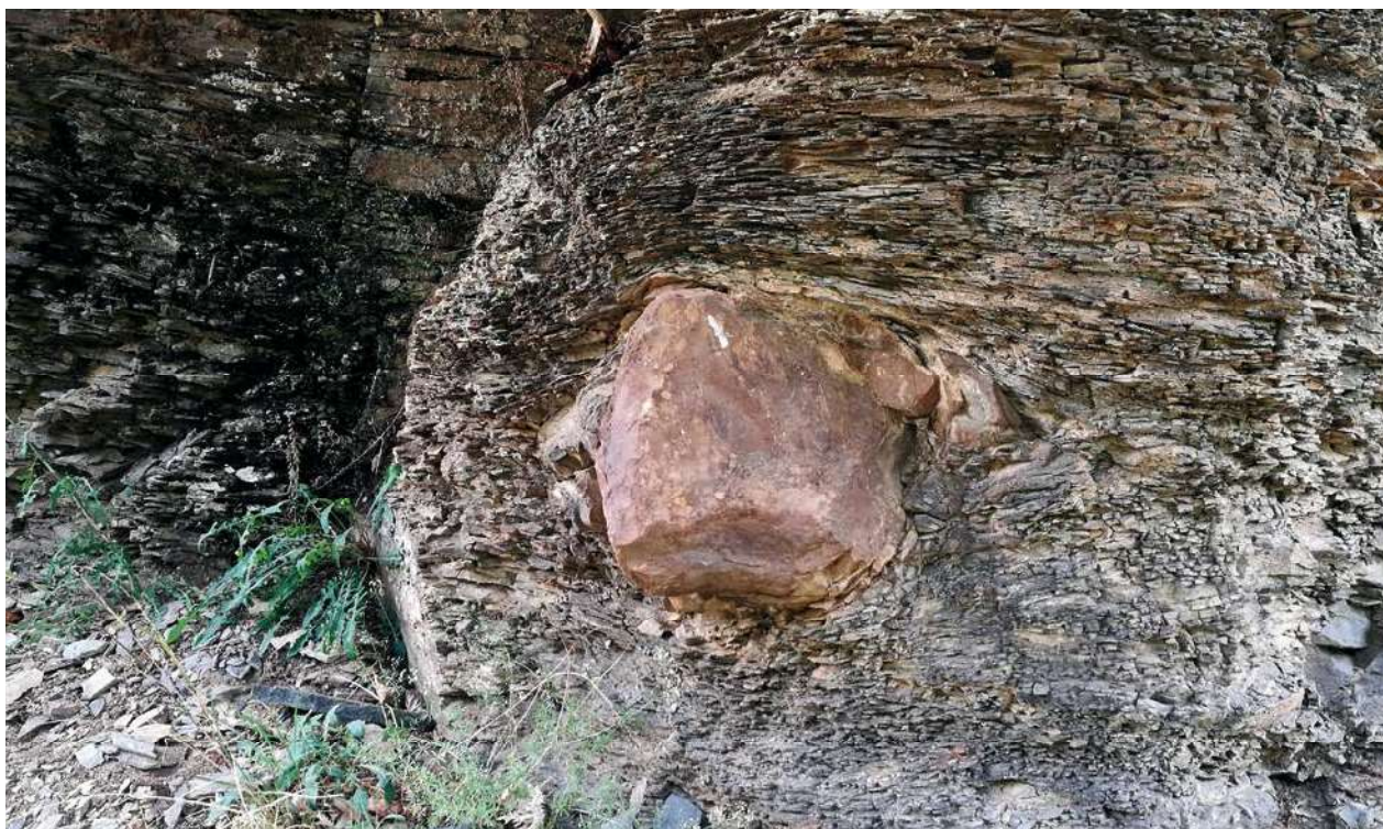
AFBEELDING. | Een zogenaamde dropstone in schalies uit het Ordovicium in Spanje. Deze dropstones vallen op de zeebodem en zinken erin als er aan het oppervlak ijsbergen voorbijrijden die langzaam smelten en hun vracht loslaten. Het is duidelijk bewijs van de aanwezigheid van ijs.

René H.B. Fraaije, directeur Oertijdmuseum, Boxtel